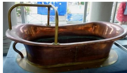
Une baignoire en cuivre d'époque rappellera combien l'eau est aussi source... de bien-être